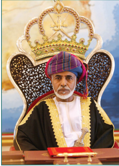
حضرة صاحب الجلالة السلطان قابوس بن سعيد المعظم - حفظه الله ورعاه